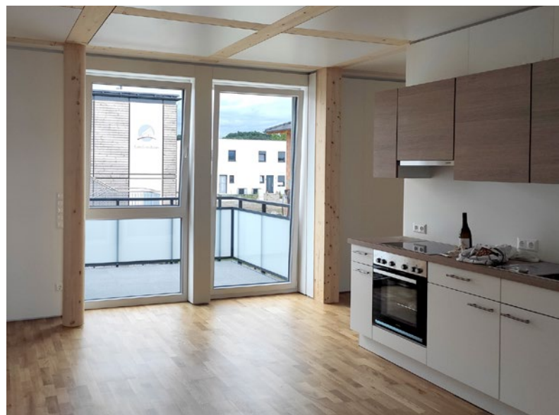
Innenaufnahmen einer vergleichbaren Wohnung (gleiche Ausstattung, ähnlicher Grundriss)